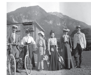
Kandinsky mit seiner „Phalanx“-Klasse in Kochel, Sommer 1902

Im frühen 20. Jahrhundert kamen die jungen Expressionisten aus München hierher, um die Natur in kraftvollen Farben und Formen zu erfassen.