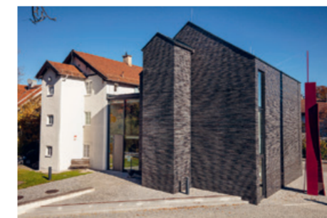
Museum Penzberg – Sammlung Campendonk

Das Museum Penzberg – Sammlung Campendonk beherbergt seit 2016 die weltweit größte Sammlung seiner Werke. Besonders mit seinen Hinterglasmalereien hat er Kunstwerke von ganz eigener Schönheit, Meisterschaft und Faszination geschaffen.