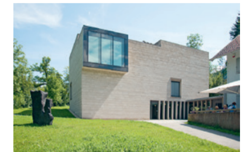
Franz Marc Museum – Kunst im 20. Jahrhundert