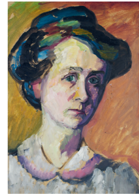
Gabriele Münter Selbstbildnis 1909 Öl auf Malpappe Schloßmuseum Murnau

Das den Ortskern bestimmende Schloßmuseum bietet seinen Besuchern eine erlesene Sammlung. Das Herzstück bilden Werke von Gabriele Münter sowie Arbeiten der Künstler der »Neuen Künstlervereinigung München« und des »Blauen Reiters« wie u. a. Wassily Kandinsky, Marianne von Wrefkin, Alexej von Jawlensky. Die Exponate veranschaulichen, wie die Künstler seit 1908 in Murnau und Umgebung ihre Bildmotive