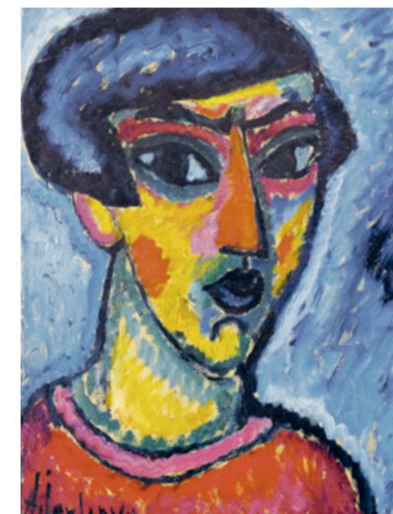
Alexej von Jawlensky Kopf in Blau, 1912 Buchheim Museum der Phantasie

Kultureller Höhepunkt ist das Buchheim Museum der Phantasie, das Olympia-Architekt Günter Behnisch ans Bernrieder Ufer des