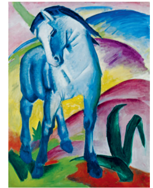
Franz Marc Blaues Pferd, 1911

Eine Fülle von hochkarätigen Museen und Sammlungen mit Exponaten von der Antike bis zur Gegenwart gibt es in München zu entdecken. Jahrhundertlang förderten die Wittelsbacher die Kunst in der Residenzstadt, die heute in zentraler Lage ein Kunstareal mit Museen von Weltrang zu bieten hat. Hier erwartet Sie z. B. die weltweit größte Sammlung an Werken des »Blauen Reiters«. Das Museum in der ehemaligen Künstlerresidenz des Malerfürsten Franz von Lenbach zählt mit seinem idyllischen Garten zu den schönsten Orten der Stadt. Das im Stil einer toskanischen Villa erbaute Gebäude steht in spannendem Verhältnis zum gold-glänzenden Neubau des Architektenbüros Foster + Partner. Seit der Schenkung 1957 durch die Künstlerin Gabriele Münter beherbergt das Museum Arbeiten von Wassily Kandinsky, Gabriele Münter, Alexej von Jawlensky, Marianne von Wrefkin, Franz Marc, Paul Klee, August Macke und vielen anderen. Unter dem Namen »Blauer Reiter« fand