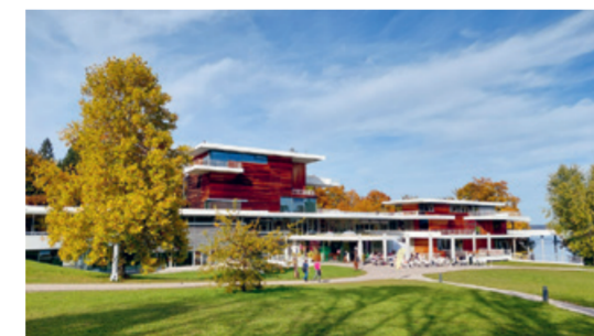
Buchheim Museum der Phantasie

Starnberger Sees setzte. Neben der berühmten Expressionistensammlung von »Boot«-Autor Lothar-Günther Buchheim begeistern Kunstwerke aus aller Welt. Kinder lieben den Zirkus Buffi, den Unterwasser-BMW, den bunten Hubschrauber und das Labor der Phantasie zum Klettern und Werken. Ein hochkarätiges Programm zieht ganzjährig viele Besucher an. Der romantische Museumspark lädt zum Picknick ein.